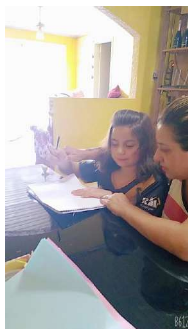
Atividades pedagógicas da Escola executadas em casa com auxílio das famílias

Sede: Rua Professora Maria D'Ávilla Pinto, nº 55