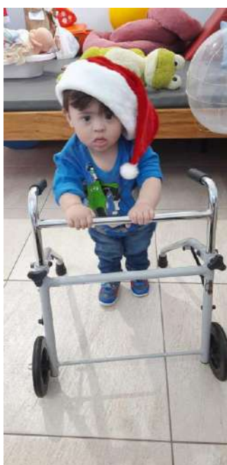
Atendimento de Fisioterapia