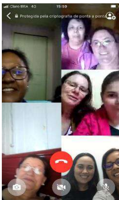
Acompanhamento multifamiliar online na Assistência Social